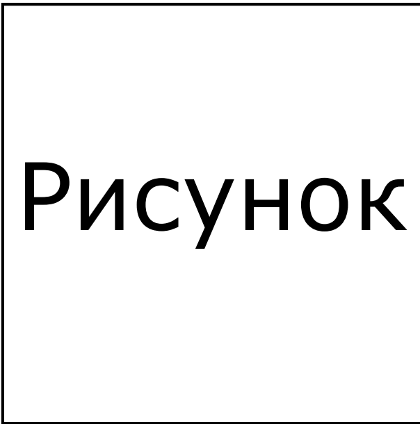
Рисунок 1. Подпись к рисунку.